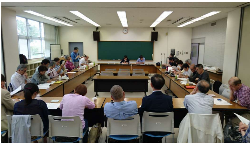
[2018 年 5 月 13 日開催の総会@神奈川県ライトセンター]