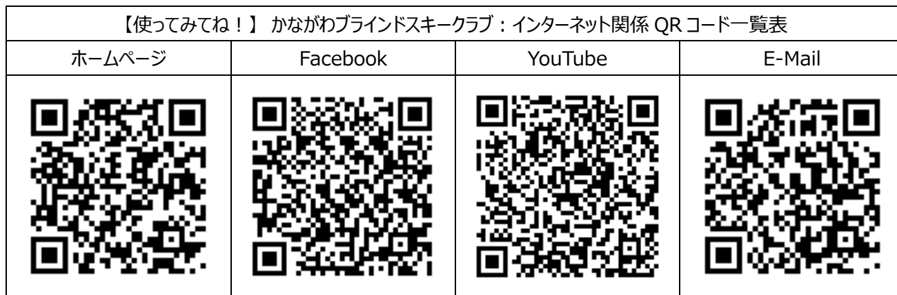
【使ってみてね！】 かながわブラインドスキークラブ：インターネット関係 QR コード一覧表

E - Mail: club.info@kanagawa-blindski.com